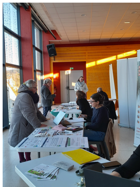
Forum " Bien vivre à domicile" qui s'est déroulé le 9 décembre 2025

Outre les aides à l'habitat, qui favorisent le maintien à domicile, une nouvelle offre de logements adaptés a vu le jour sur la commune de Sainte-Florine : la résidence Clair Vivre.