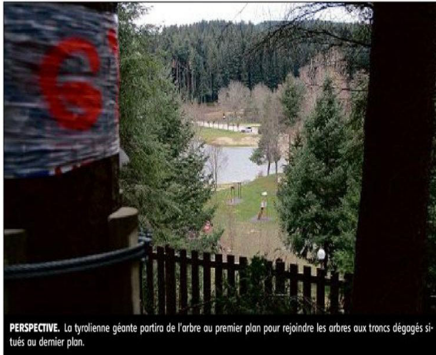
PERSPECTIVE. La tyrolienne géante partira de l'arbre au premier plan pour rejoindre les arbres aux troncs dégagés situés au dernier plan.

Il s'agissait du dernier atelier installé par la société 2VG aventure de Saint-Paulien et ses sous-traitants sur ce chantier lancé début septembre dans le bois surplombant le plan d'eau de Champagnac-le-Vieux. Les travaux devraient s'achever avec l'installation de la cabane qui servira à l'accueil, l'encaissement et l'équipement du public, ainsi que l'aménagement des accès au parc, qui devrait logi-