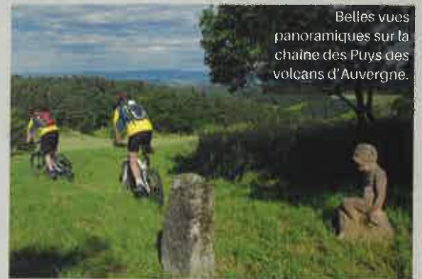
Belles vues panoramiques sur la chaîne des Puys des volcans d'Auvergne.

Espace VTT/FFC "Le Bassin du Puy-en-Velay, entre patrimoine et volcans" . 542 km de parcours balisés. Ouverture en mai 2016 pour ce nouveau site. Entre la vallée de la Loire et le plateau volcanique des itinéraires pour tous niveaux de pratique. O.T. du Puy-en-Velay : 04 71 09 38 41.