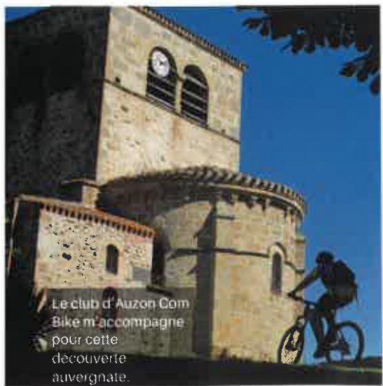
Le club d'Auzon Com Bike m'accompagne pour cette découverte auvergnate.

Pour en savoir plus sur Auzon et sa région, consultez la brochure "Laissez-vous conter Auzon". Disponible à L'O.T. d'Auzon.